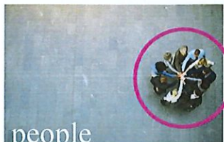
Persone che fanno squadra che si occupano l'una dell'altra.

Istituto di Vigilanza Coopservice S.p.A. vuole essere leader nel mondo dei servizi di vigilanza, portierato e security, con l' innovazione continua dei servizi, l'impegno per la sostenibilità ambientale , la riduzione delle emissioni dei gas ad effetto serra, la valorizzazione della qualità del lavoro, la sicurezza delle informazioni, la sicurezza e salute sul lavoro e stradale: mettendo al centro i clienti e la collettività, valorizzando la professionalità e le aspirazioni dei propri soci e lavoratori.