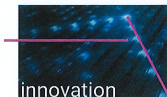
Innovazione che è progresso, spingersi più in là, movimento.