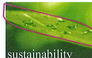
Perseguire il massimo della sostenibilità ambientale è una responsabilità di tutti

La Direzione Istituto di Vigilanza Coopservice S.p.A. si impegna a: