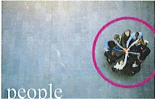
people Persone che fanno squadra che stoccano l'una dell'altra.

Coopservice vuole essere leader nel mondo dei servizi integrati, con l'innovazione continua dei servizi, l'impegno per la sostenibilità ambientale, la riduzione delle emissioni dei gas ad effetto serra, la valorizzazione della qualità del lavoro, la sicurezza delle informazioni, la sicurezza sul lavoro e stradale: mettendo al centro i clienti e la collettività, valorizzando la professionalità e le aspirazioni dei propri soci e lavoratori.