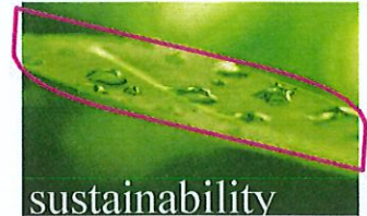
sustainability Perseguire il massimo della sostenibilità ambientale è una responsabilità di tutti